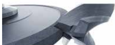
Шлифование и хонингование