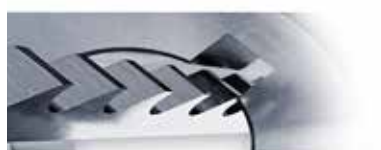
Протягивание и долбление