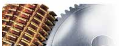
Обработка червячной фрезой